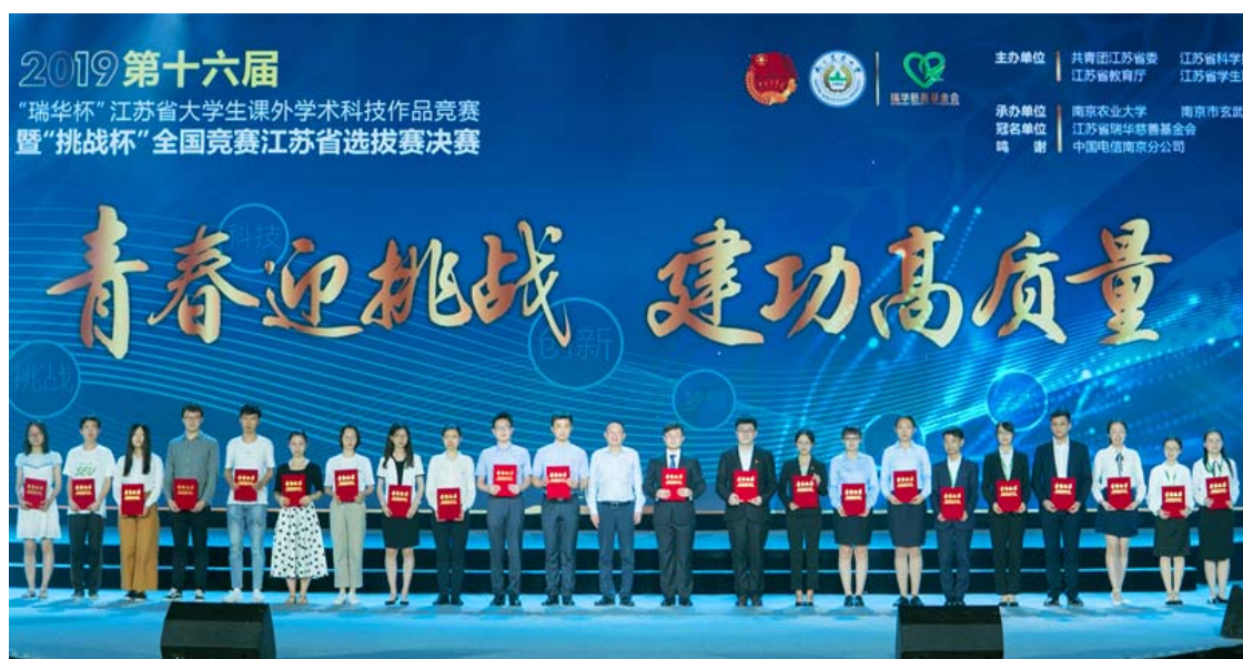
特等奖获奖团队代表（右二）领奖

5月24日-26日，第十六届“挑战杯”全国大学生课外学术科技作品竞赛江苏省选拔赛决赛在南京农业大学举行。南京中医药大学报送7件参赛作品，共获特等奖1项、一等奖4项、二等奖2项，5件作品入围国赛，学校再次获“优秀组织奖”。