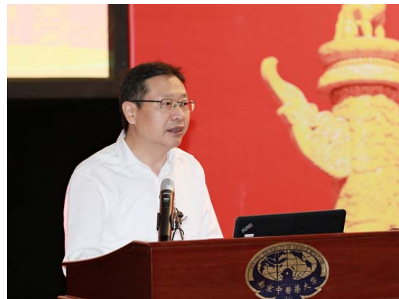
江苏省委教育工委徐子敏副书记讲话

全国高等中医药院校党建和思想政治工作研究会谷晓红理事长在开幕词中指出，一年来，研究会充分利用“理论研究、实践探索、经验交流、成果总结”的功能，积极发挥高校人才优势、智力优势、平台优势，将理论与实际工作紧密结合，不断探索并总结党建、思政工作的规律和特点，努力推出高水平的理论研究成果，致力于解决高等中医药院校党的建设的的关键问题。此次年会在党的十九大前夕召开，就是要总结高等中医药院校在党建和思想政治工作中取得的经验，互相交流对党中