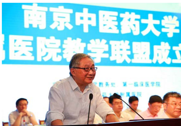
国家级教学名师、全国名中医汪受传教授致辞