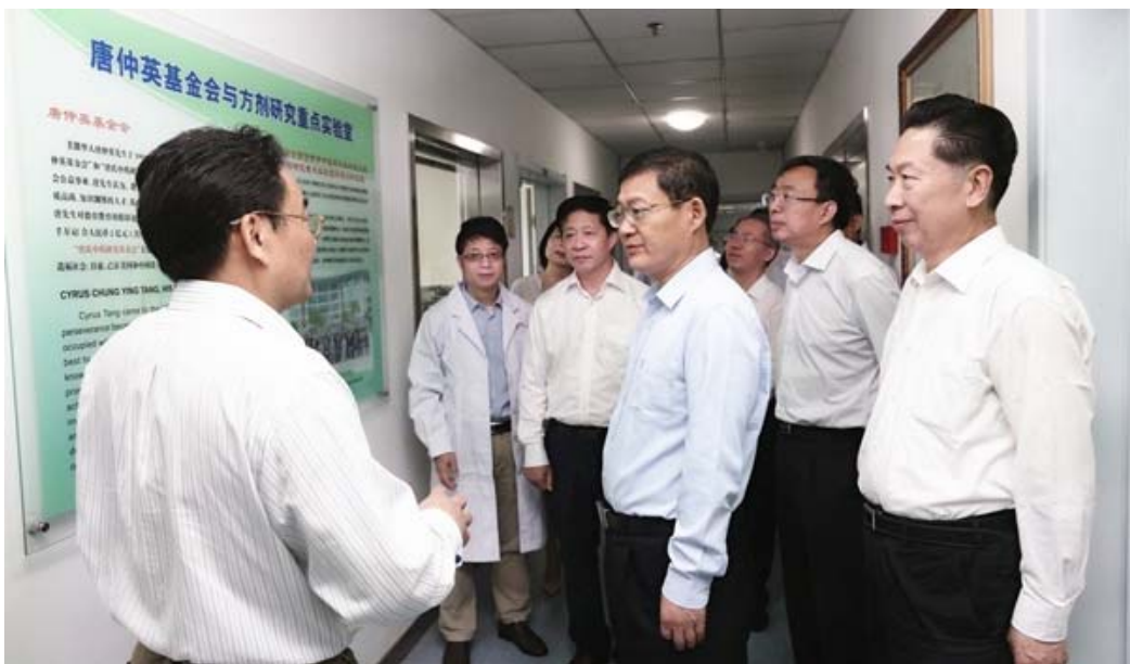
省委常委、组织部部长郭文奇在学校走访调研