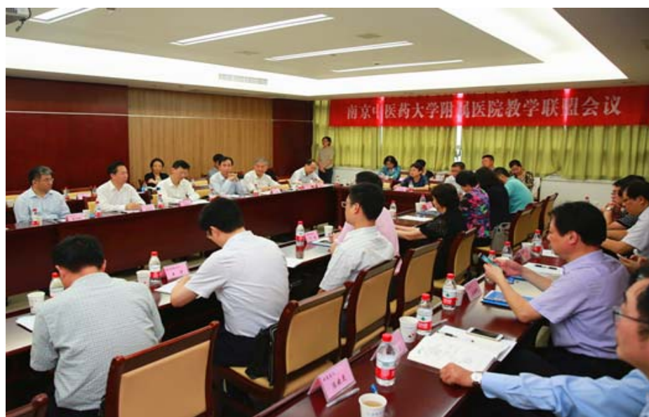
附属医院教学联盟召开工作会议

教学联盟成立大会结束后，附属医院教学联盟工作会议在南京中医药大学附属医院（第一临床医学院）南院行政楼 319 进行，校领导、学校部分职能部门负责人、各联盟医院院长、书记、分管教学院长以及附属医院院领导参会，各附属医院领导交流发言。