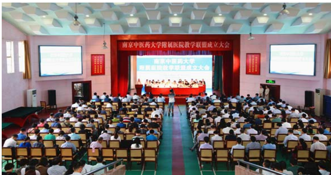
教学联盟成立大会现场

为贯彻落实全国卫生与健康大会精神和《关于深化医教协同进一步推进医学教育改革与发展的意见》（国办发[2017]63号），深化医教协同工作内涵，明确医教协同工作机制，促进学校各附属医院形成合力，形成统一建设标准、统一质量控制、统一组织管理、统一教学要求的附属医院团队，经学校研究决定，由南京中医药大学附属医院（第一临床医学院）牵头并负责组织工作，第二附属医院、第三附属医院、常州附属医院、徐州附属医院、苏州附属医院、泰州附属医院、附属中西医结合医院等其他 19 家附属医院为成员单位，共同成立“南京中医药大学附属医院教学联盟”。