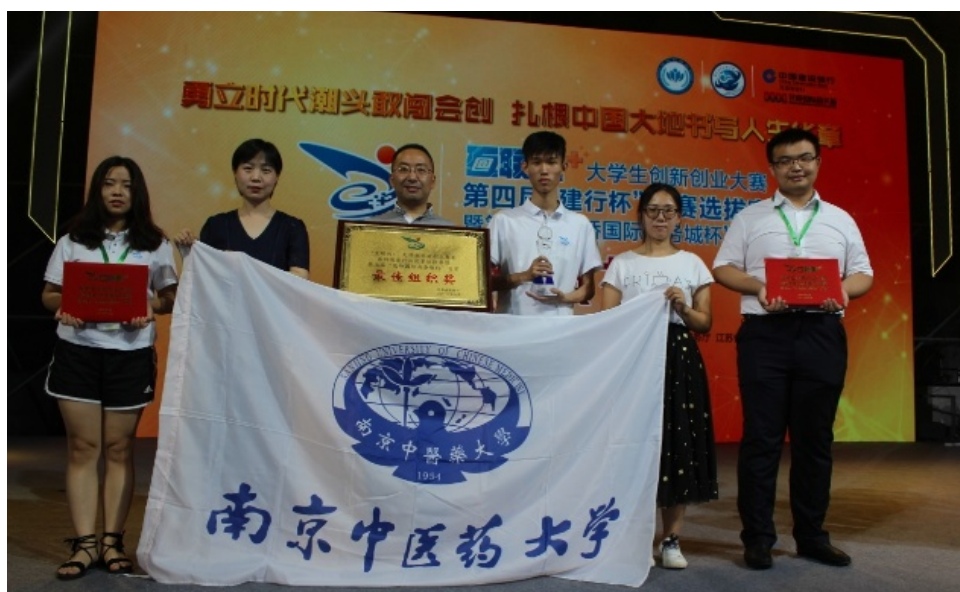
获奖师生代表合影

7月19日-21日，由江苏省教育厅联合江苏省委网信办等11个部门共同举办、南京信息工程大学承办的“互联网+”大学生创新创业大赛第四届“建行杯”国赛选拔赛暨第七届“花桥国际商务城杯”省赛决赛在南京举行。我校学生参赛作品获一等奖1项、二等奖1项、三等奖2项，同时获优秀组织奖，总成绩位列全省高校前列。