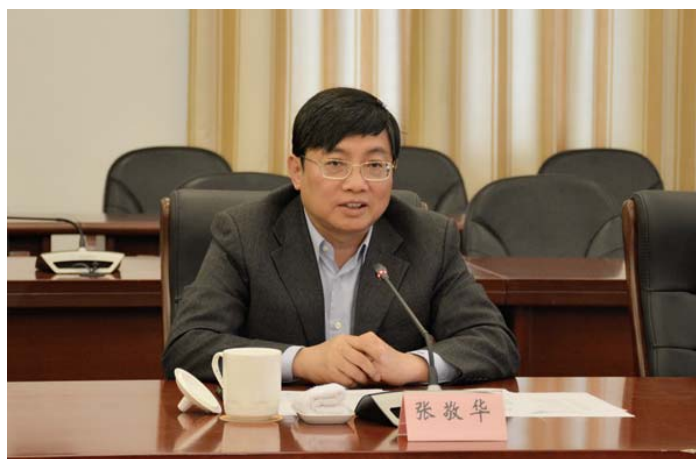
省委常委、南京市委书记张敬华讲话

示范作用，是南京的一张亮丽名片。他表示，南京中医药大学属地在南京，有责任、有义务为南京经济社会和卫生健康事业发展作出新的更大的贡献，有责任、有义务把南京这张“健康名片”擦新擦亮，有责任、有义务更好地开创中医药事业发展的“南京风格”“南京气派”。此次政校合作共建直属附属医院，就是要进一步深化医教协同提升医学人才培养质量，提升中医药服务能力和临床科研水平，共同打造优势学科、专病专科和治未病研究中心，努力形成具有全国影响力的特色诊疗高峰和中医学学术传承基地。