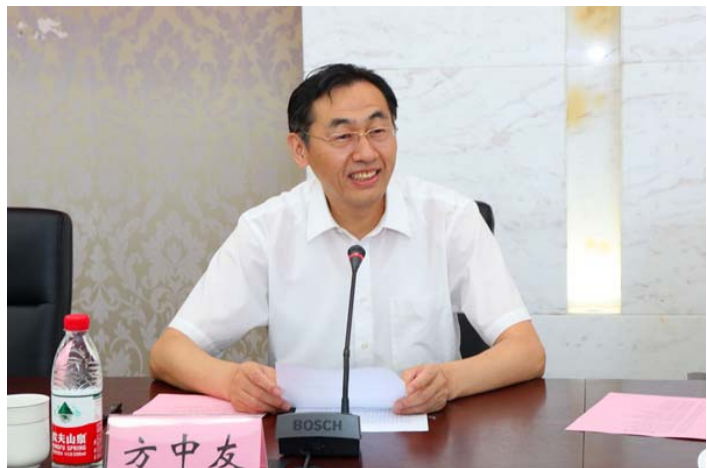
南京市卫计委主任方中友讲话