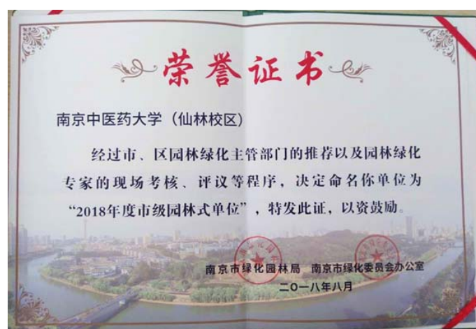
南京中医药大学荣获“南京市园林式单位”称号