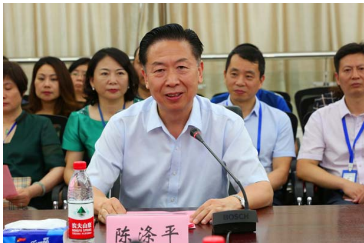
南京中医药大学党委书记陈涤平讲话