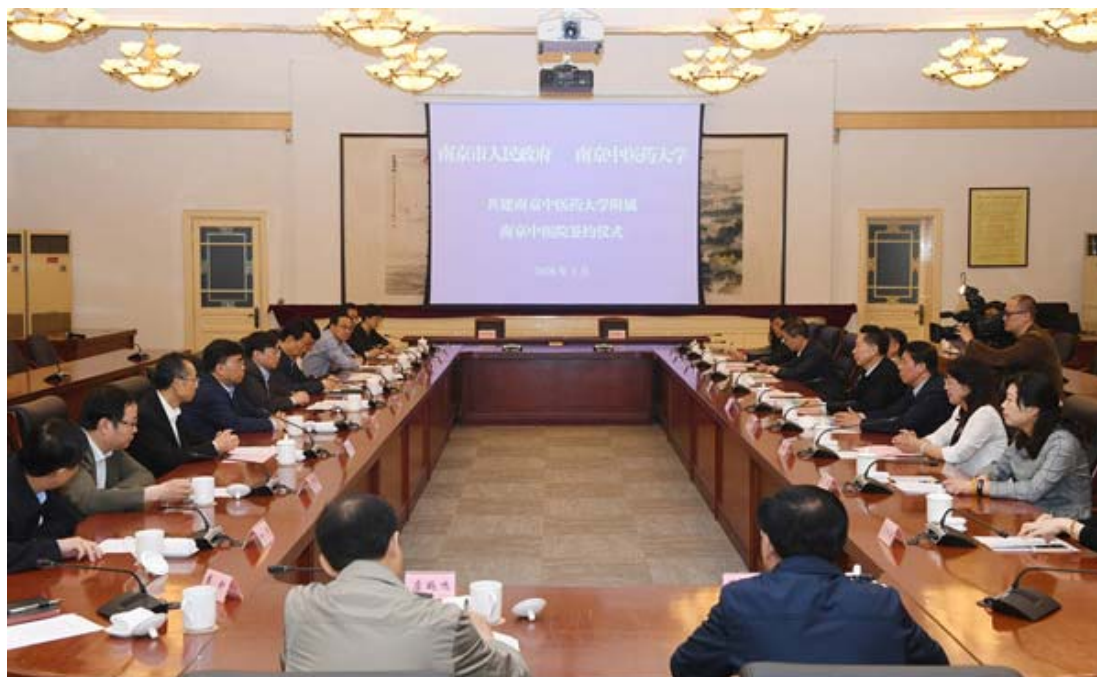
共建南京中医药大学附属南京中医院签约仪式现场

南京市委常委、常务副市长杨学鹏，市政府党组成员、秘书长翁国玖，市政府办公厅、市卫计委、秦淮区委、南部新城管委会、市中医院有关负责同志，学校副校长黄桂成、徐桂华和有关职能部门负责人参加了签约仪式。